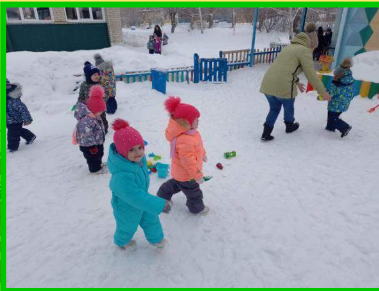
«У медведя во бору...»